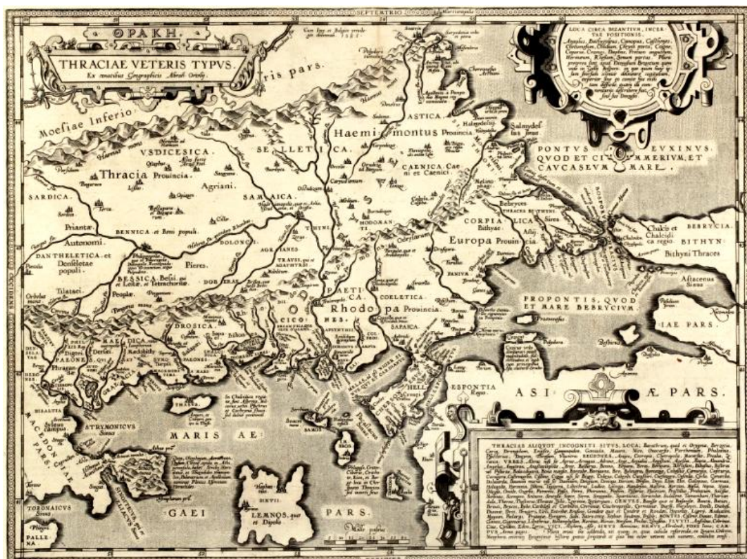
Rycina 2. Mapa antycznej Tracji Abrahama Orteliusa, 1595 r.